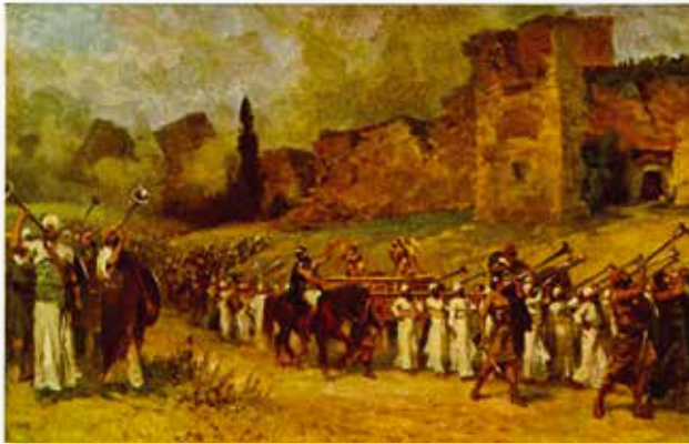
Walls of Jericho

Dores laat diverse afbeeldingen zien aan de hand waarvan de ontwikkeling te zien is die de muziek de afgelopen eeuwen heeft doorgemaakt. Onder meer werd getoond functionele muziek: