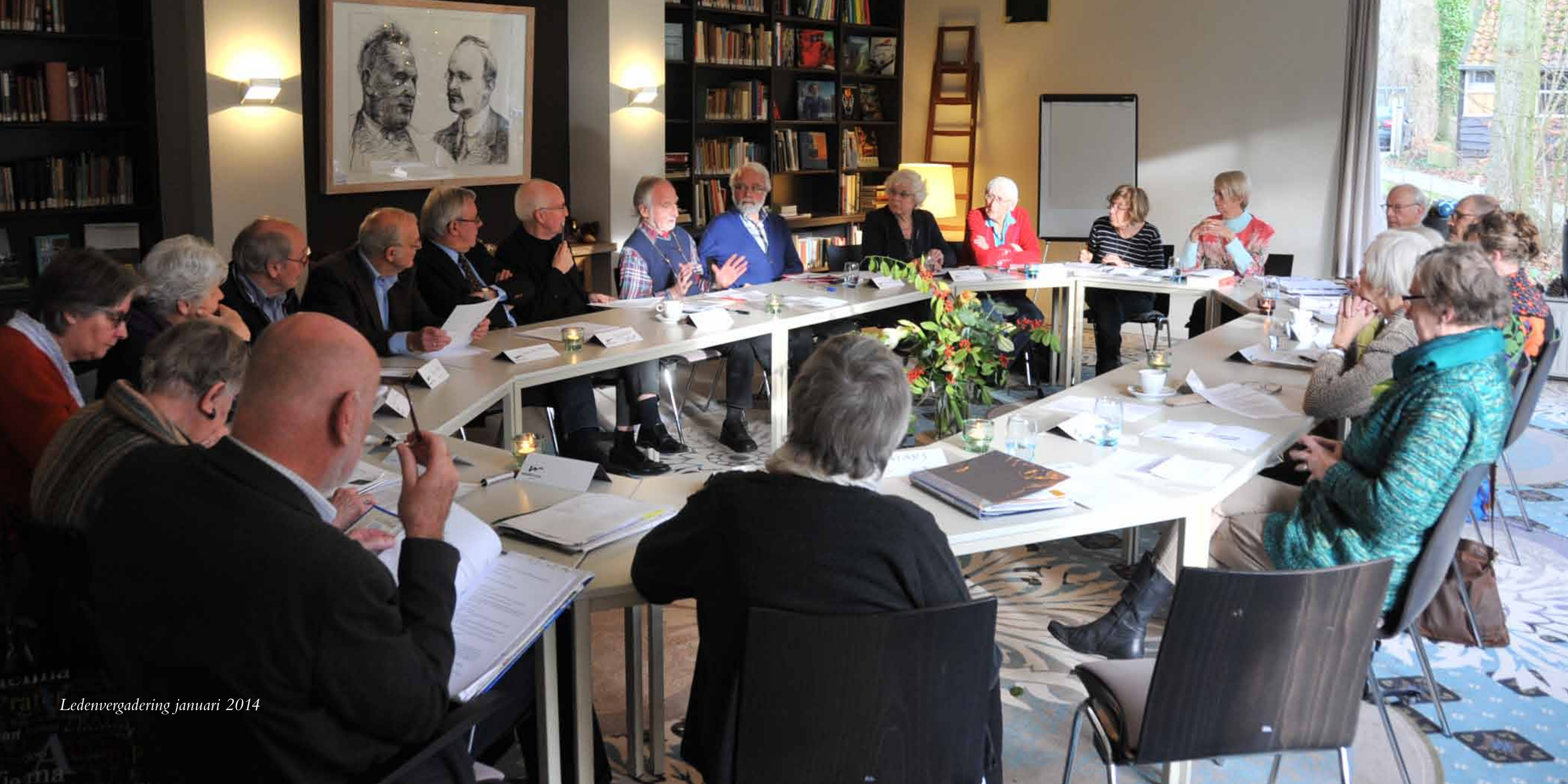
Ledenvergadering januari 2014